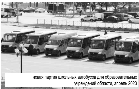
новая партия школьных автобусов для образовательных учреждений области, апрель 2023