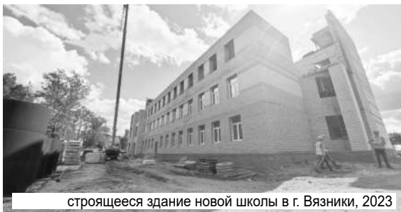
строится здание новой школы в г. Вязники, 2023

Сегодня уже со всей очевидностью можно сказать, что система образования Владимирской области активно встраивается в стратегию научно-технологического развития России. В частности, в 2025-2027 годах в регионе будет создана разветвленная сеть пилотных площадок по образовательной робототехнике и искусственному интеллекту. Центром научно-методического сопровождения проекта определен детский технопарк «Кванториум-33». Кроме того, планируется дооснастить школьные кванториумы и «IT-кубы», а в областном центре «Олимп» – сформировать современную цифровую среду.